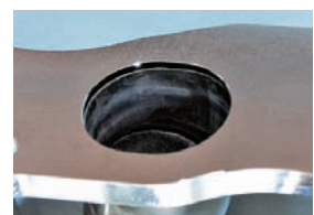
ポート内部拡大写真