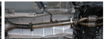
サーキット仕様状態