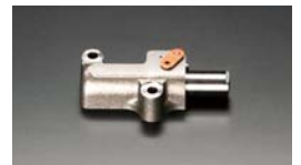
K20A 強化チェーンテンショナー