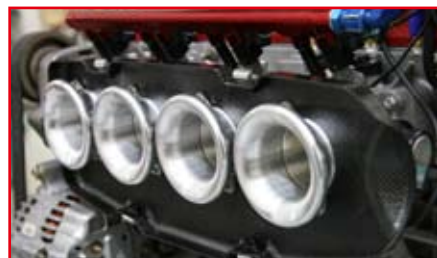
※画像のエアファンネルは 33mmを使用。スペースの制約により33mmエアファンネルを使用してください。