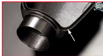
気密性保持、そして振動破損防止に、O-ring シールを採用。