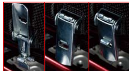
調整式レバー・ロックファスナー